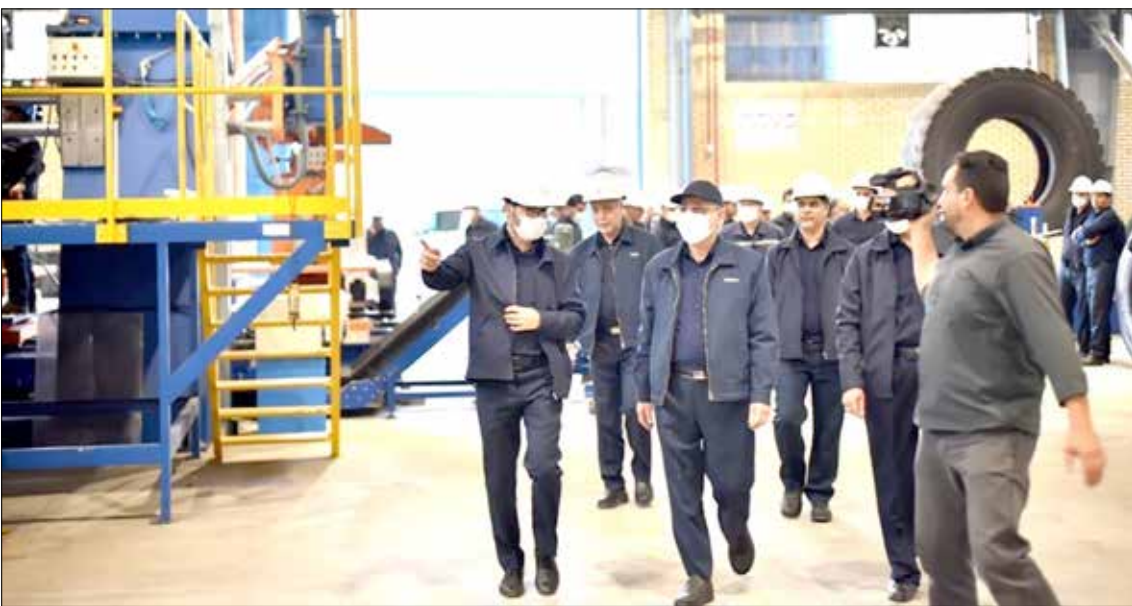
۱۴۰۲ اجرائی شده است.

فولادی‌ها سال ۴ ماه به دلیل قطعی انرژی تولیدشان دچار مشکل می‌شود؛ بیش از دو ماه گاز و یک و نیم ماه به دلیل برق، محدودیت‌هایی که تولید سالانه فولاد را قدری پایین کشید که ایران جایگاه دهمین تولیدکننده فولاد جهان را از دست بدهد. پیش‌از این ایران از سال ۲۰۱۸ تا ۲۰۲۲، دهمین تولیدکننده بزرگ فولاد جهان در فهرست انجمن جهانی فولاد بود و در دوماه نخست سال ۲۰۲۳ نیز ایران بالاتر از ترکیه جایگاه نهمین تولیدکننده بزرگ فولاد جهان را داشت.