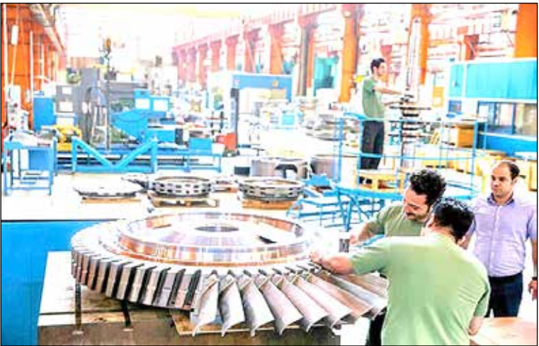
بر رشد منفی زیر گروه صنعت و معدن در دولت دوازدهم است.