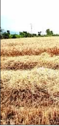
پارک کشاورزی در اراک

باد می‌تواند یکی از دلایل شیوع بیماری‌های مربوط به گیاهان باشد. گاهی یک آفت یا بیماری مربوط به گیاهان به کمک باد فرسنگ‌ها مسافت را طی می‌کند و به لحاظ فزونی‌ترین نقاط هم می‌رسد. ویروس و باکتری‌ها هم می‌توانند به کمک حشرات یا دیگر مزارع و گیاهان برسند و آن‌ها را از بین ببرند. با این حال، بیشترین کمک را انسان‌ها می‌کنند. آفت‌ها را از انسان‌ها به خیال خودشان تلاش می‌کنند آفت‌ها را از بین ببرند. با این حال، با روش‌های غلط منجر به شیوع بیشتر آن‌ها می‌شوند. حتی گاهی گیاهان کوچک را از بین می‌برند. بهترین راه برای اینکه جلوی شیوع بیماری‌های مربوط به گیاهان را بگیریم این است که از نقاط جهان خواهیم بود.