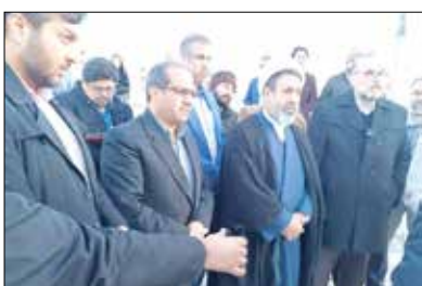
سیدمهدی قویدل گفت: دستگاه قضایی استان این آمادگی را دارد با حمایت حقوقی و قضایی از مجموعه شهرداری در جهت حل مشکلات شهری نقش خود را ایفا نماید.

معاون دادگستری کل استان کرمان در نشست جمع بندی بازدید پروژه های سطح شهر کرمان بر لزوم تکمیل پروژه های در حال احداث شهرداری و همچنین اعتماد سازی شهرداری در راستای مشارکت مردم و بخش خصوصی در پروژه های شهری تأکید کرد.