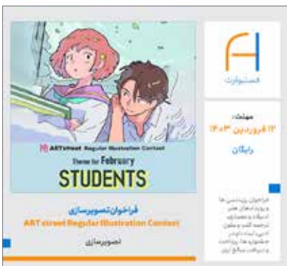
فراخوان تصویرسازی ماه فوریه ۲۰۲۴