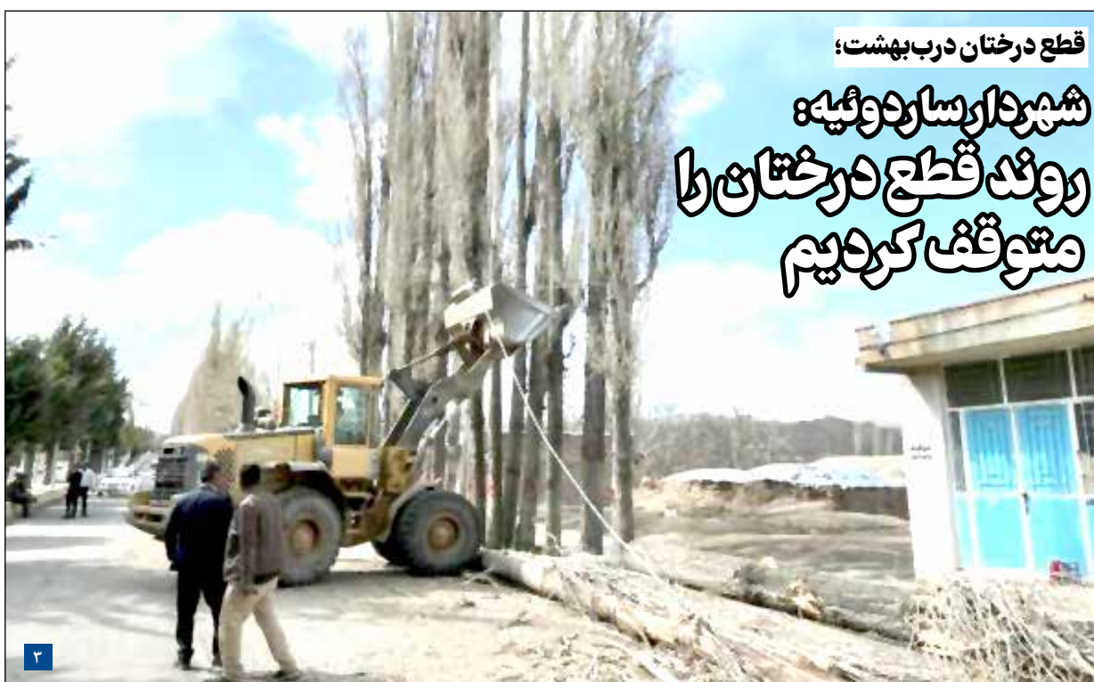
قطع درختان درب بهشت؛

شهردار ساردوئی: روند قطع درختان را متوقف کردیم