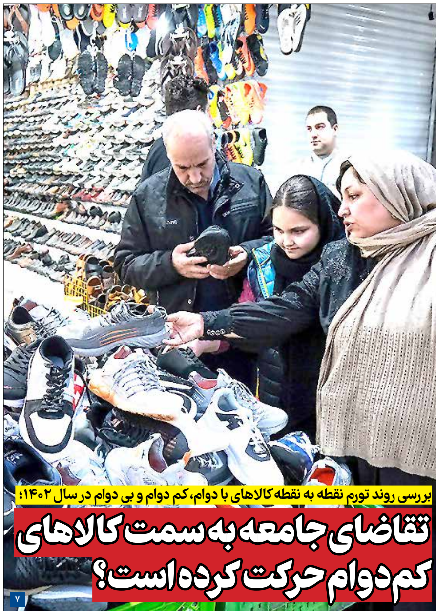
بررسی روند تورم نقطه به نقطه کالاهای با دوام، کم دوام و بی دوام در سال ۱۴۰۲؛

گندم‌کاران در جنوب کرمان به روزهای پایانی برداشت نزدیک شده بودند که به یکباره خبر ورود سامانه بارشی به منطقه آمد. سامان‌ای که با حجم بارش و شدت اثر آن همه معادلات کشاورزان را بهم زد.