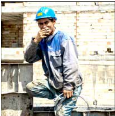
طرح دعوی کنند. در صورت خودداری کارفرمایان از پرداخت جریمه مقرر در این بند، تعقیب کیفری براساس ماده (۱۸۱) قانون کار مصوب ۲۹ آبان ۱۳۶۹ مجمع تشخیص مصلحت نظام به عمل خواهد آمد.

نمایندگی‌های سیاسی خارجی که در نمایندگی‌های مربوط اشتغال دارند، مشروط به رعایت عمل متقابل توسط کشور مذکور از پرداخت وجوه فوق مستثنی هستند. در بند (ج) این ماده قانونی آمده است که به منظور جلوگیری از حضور نیروی کار غیرمجاز خارجی در بازار کار کشور، وزارت تعاون، کار و امور اجتماعی مکلف است کارفرمایانی که اتباع خارجی فاقد پروانه را به کار می‌گیرند بابت هر روز اشتغال غیرمجاز هر کارگر خارجی معادل پنج برابر حداقل دستمزد روزانه جریمه کند و در صورت تکرار تخلف این جریمه ۲ برابر خواهد شد. برپایه این گزارش، درآمد حاصله به درآمد عمومی (نزد خزانه داری کل) واریز خواهد شد. کارفرمایان مذکور در صورت اعتراض می‌توانند در محاکم صالحه