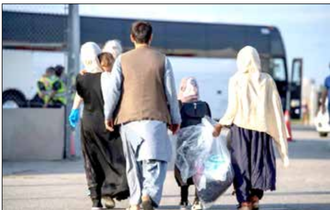
بر بازگرداندن تمامی اتباع خارجی غیر مجاز است و در این باره برای هیچ گروهی تفاوت قائل نخواهیم شد.