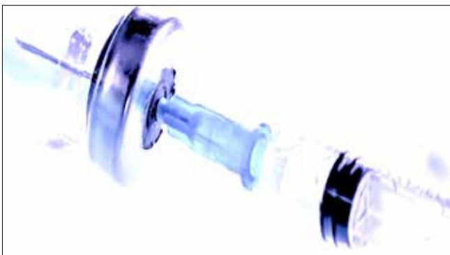
روتاویروس عمدتاً در بین کودکان ۳ ماهه تا ۳ ساله واکسینه نشده، رخ می‌دهد. همچنین برخی بزرگسالان مانند افراد مسن و افرادی که نقص سیستم ایمنی دارند در معرض خطر بیشتری برای ابتلا به روتاویروس هستند.

استفراغ، تب، درد در ناحیه شکم همراه است که می‌تواند منجر به کم‌آب شدن بدن شود. بنابر اعلام دفتر آموزش و ارتقاء سلامت وزارت بهداشت، روتاویروس از دو روز از ظهور علائم در مدفوع بیمار یافت می‌شود و از طریق مدفوع دهانی و تماس نزدیک بین افراد منتقل می‌شود. بیماری از فرد بیمار، ناقل سالم (فردی که آلوده به میکروب است اما علائم بیماری ندارد) و همچنین اشیاء آلوده شده با ترشحات بدن، قابل انتشار است. این ویروس می‌تواند روی سطوحی که ضد عفونی نشده‌اند برای هفته‌ها یا ماه‌ها زنده بماند. کودکان بیشتر در خطر ابتلا به بیماری روتاویروس هستند. بیماری