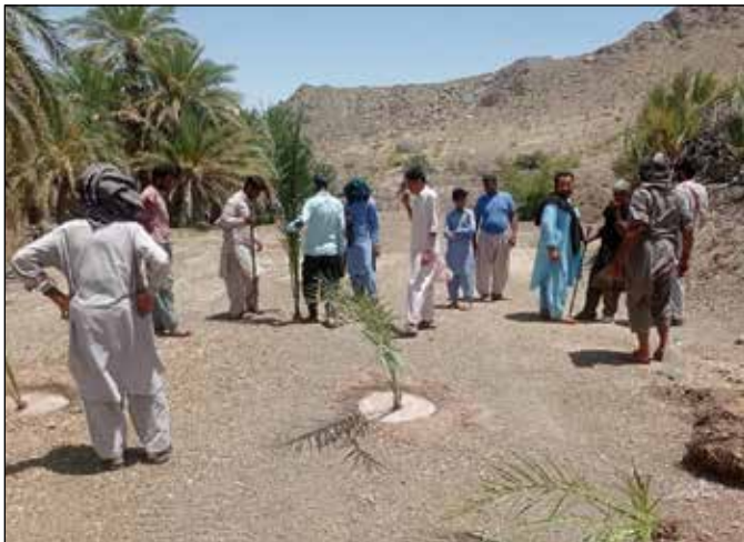
عکس کاغذ وطن

نماینده معترضان: رأی مالکیت از دادگاه گرفتیم، اما از ما سند می خواهند در حالی که حتی منازل ما سند ندارد