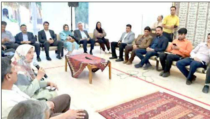
سنی و قلم‌زنی ماه، موزه در خورشان را می‌طلبد.