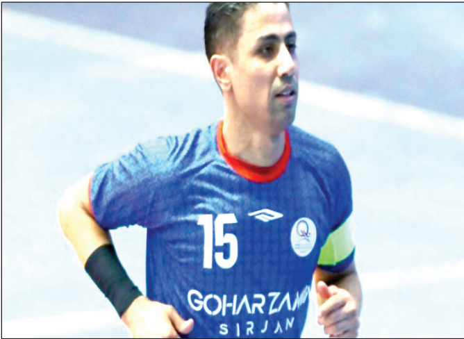
اگر هم نباشیم برای سر بلند و توفیق تیم ملی دعا خواهیم کرد.