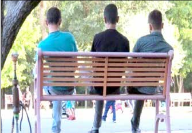
که ارائه راهبردهای اجرایی جهت کنترل آنها و گسترش مهاجرت معکوس ضروری است.

همچنین مرکز پژوهش‌های مجلس در خصوص «ضرورت ساماندهی مهاجرت داخلی» آورده است که توجه به گسترش مهاجرت معکوس ضروری است. براساس این گزارش، شناخت عوامل اصلی مهاجرت داخلی در راستای کاهش پدیده گمنامی در شهرها، کاهش سن ازدواج، افزایش هم‌قوم‌گزینی و افزایش پایداری خانواده، ضروری است. از عوامل اصلی گسترش مهاجرت‌های داخلی دسترسی به شغل و تحصیل را می‌توان نام برد