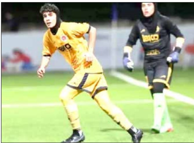
عکس ورزش سه

کنیم. از نظر روحی شرایطمان خوب است و بعد از ریکاوری تمریناتمان هم دوباره شروع شده. باز یک خاتون در انتهای این گفت و گو با مردم صحبت کرد و گفت: مردم بدانند که قدر حمایت هایشان را می دانیم. دست تک آن ها را می بوسیم که از دخترهای خودشان اینطوری حمایت می کنند و این برای ما خیلی بالارزش است. از آنها می خواهیم که باز هم دعایمان کنند و برایمان انرژی مثبت بفرستند؛ چون تمام انگیزه ما همین مردم هستند.