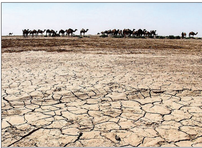
تالاب خشک شده جزموریان در جنوب کرمان

حفظ جزموریان نه تنها برای مردمان کرمان و سیستان و بلوچستان، بلکه برای تمام ایران اهمیت استراتژیک دارد. این