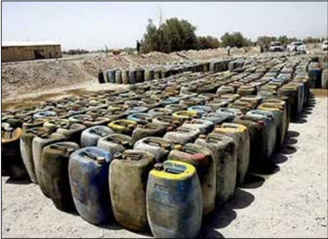
مجلس را حافظ حقوق بیت المال می دانند، اضافه کرد: ما در قانون برنامه توسعه، ارز چند قیمتی و سرکوب قیمت انرژی نداریم. یعنی قانون برنامه توسعه ما اگر چه بی نقص نیست ولی پایه های خوب است. اینجا نقش مجلس پررنگ می شود و می تواند جلوی تخلف را بگیرد و از خودش هم هزینه کند، اما مجلس همیشه به صورت نامحسوس کنار می رود. مثلاً در قانون برنامه قیمت ارز شناور است، اما ما چندین نرخ ارز داریم که اکنون به دو نرخ رسیده است. سوال اصلی اینجاست که چرا مجلس بر اساس همان قانون برنامه توسعه جلوی آن را نمی گیرد. این کارشناس اقتصادی تصریح کرد: لایحه برنامه توسعه که به مجلس می آید با ساختار قانون برنامه توسعه متناقض است اما دولت لایحه ای که تدوین می کند پوپولیستی است که به صورت عجیبی در مجلس فراگیر هست.