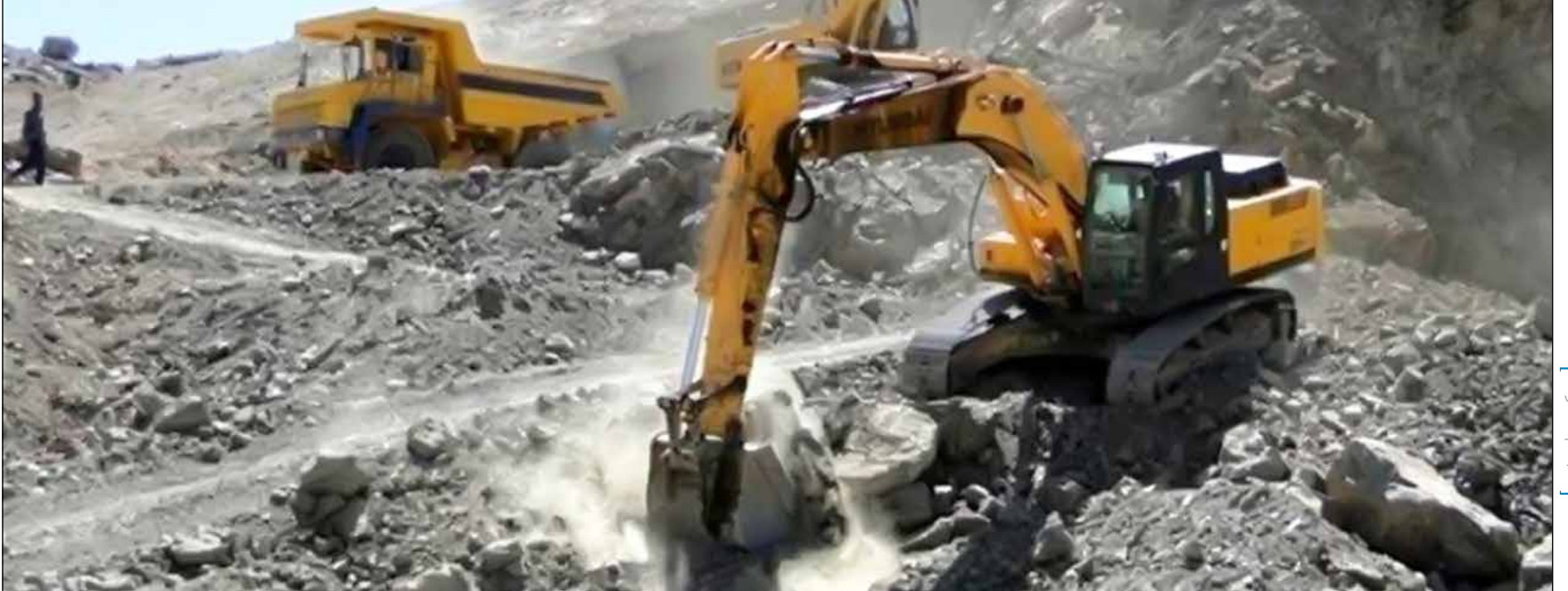
عکس صدای زنگ