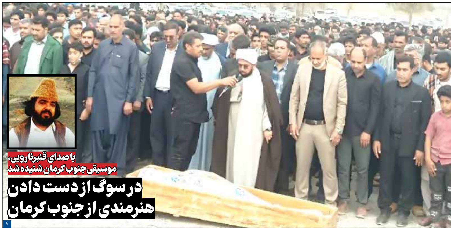
با صدای قشربارویی، موسیقی جنوب کرمان شنیده شد

کاغذ وطن - استان کرمان رتبه دوم سطح زیر کشت و رتبه سوم تولید محصولات گلخانه‌ای را در کشور دارد. این جایگاه‌ها از سال‌ها قبل برنامه‌ریزی شده بود چرا که پسته