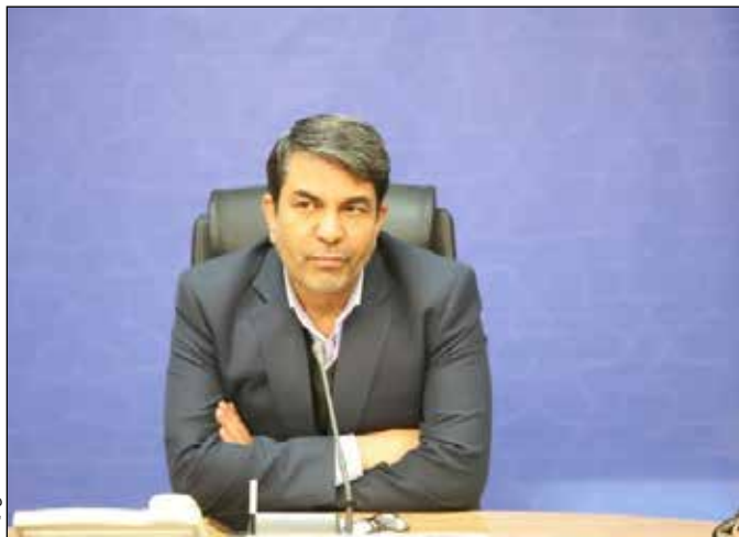
سرنانه فضای سبز و ارتقای جلوه بصری شهرها بر شمرده.

آیت اللهی موسوی بر لزوم به روز رسانی تابلوهای راهنمای شهری برای تسهیل تردد مسافران تأکید کرد و گفت: مشخص بودن مسیرهای گردشگری و اماکن خدماتی نقش مهمی در تجربه سفر دارد. او همچنین اجرای «طرح محور سبز» در ورودی شهرها و محورهای مواصلاتی را از اقدامات مهم برای افزایش